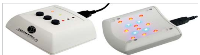
Abb. 4: Akkubetriebener Feld-Licht-Applikator (hier mit Netzkabel).

Entwicklung und Fertigung erfolgen in Deutschland. Weitere Informationen unter www.sentiplus.com