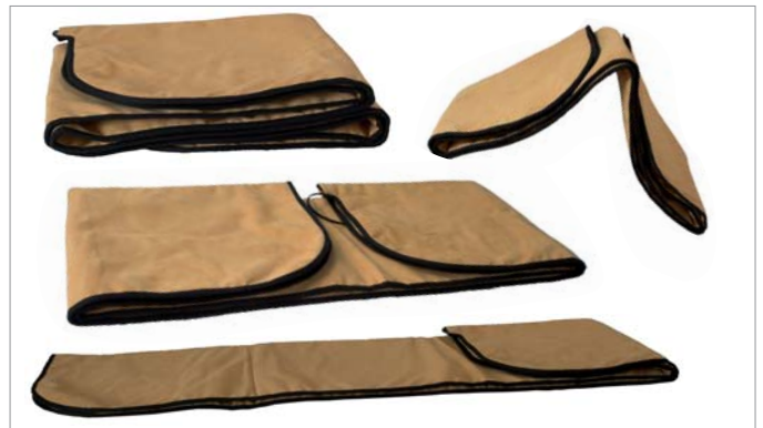
Abb. 3: Matten-Applikator mit durch Faltung individuell möglicher Intensitätserhöhung (Beispiele).

Abb. 1: Die (Fourier-)Analyse nach den im Signal enthaltenen Frequenzkomponenten zeigt die für Energieübertragungen angestrebte grosse spektrale Breite des Sentiplus Professional Signals mit deutlichen Anteilen bis in den 20 kHz-Bereich.